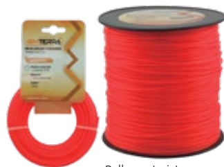
Rollos en tarjeta para exhibidor (blister) 15 m