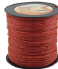
Carrete, peso: 5 lbs