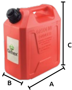
Boquilla tipo embudo