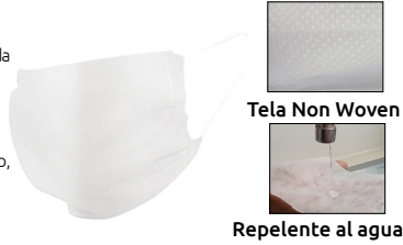
Tela Non Woven