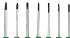
MANGO DE HULE TERMOPLÁSTICO