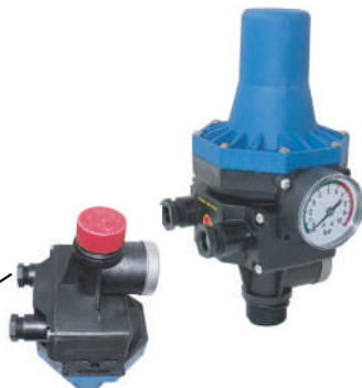
Control automático (Reset) A ras de la armadura