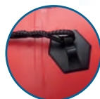
LÍNEA DE VIDA