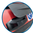
ASA PARA TRANSPORTAR