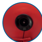
VÁLVULA DE AIRE