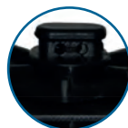
TAPÓN DE DRENAJE