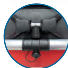
SOPORTE CON CERROJO