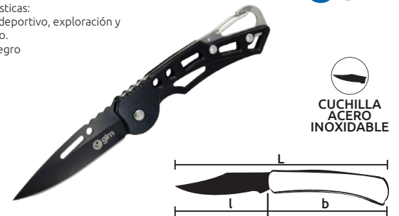
CUCHILLA ACERO INOXIDABLE