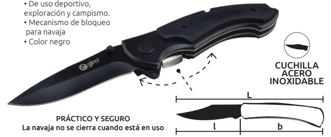
CUCHILLA ACERO INOXIDABLE

PRÁCTICO Y SEGURO La navaja no se cierra cuando está en uso