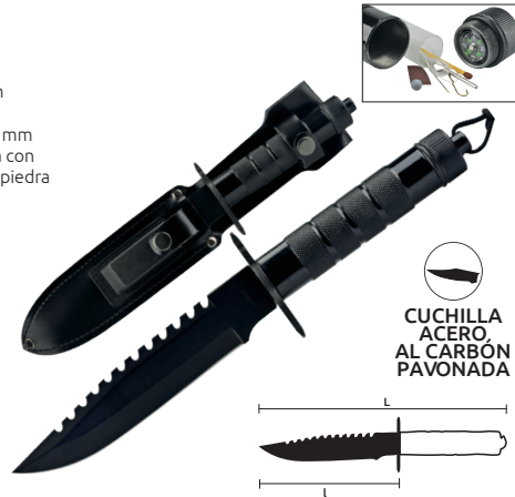
CUCHILLA ACERO AL CARBÓN PAVONADA