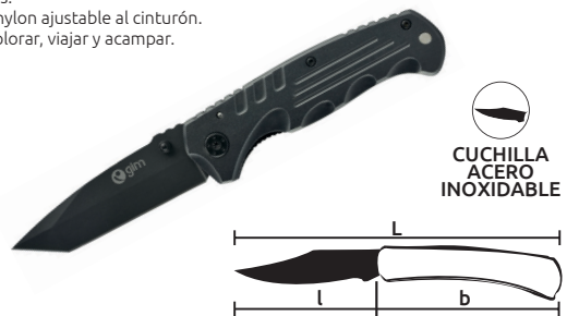
CUCHILLA ACERO INOXIDABLE