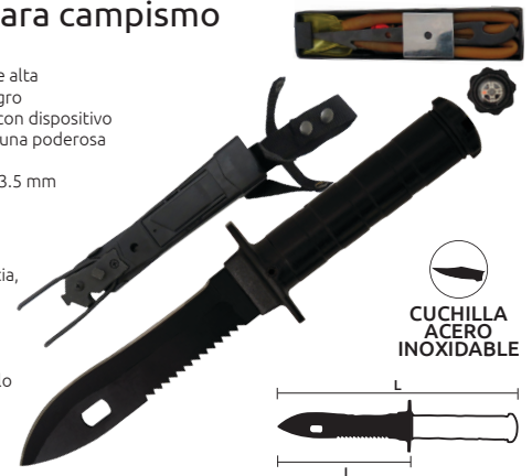
CUCHILLA ACERO INOXIDABLE