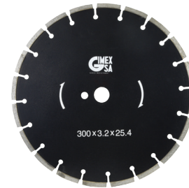
300 x 3.2 x 25.4