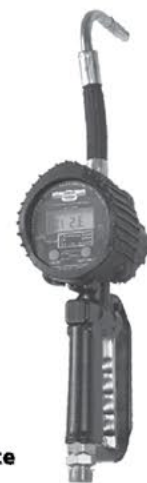
2833 Para Aceite

Te ofrecemos importar estos productos directo de fábrica REPRESENTANTE EXCLUSIVO más información en gimbel@gimbelmexicana.com