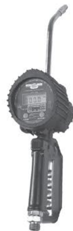
2826 Para Aceite 2830 Para Anticongelante